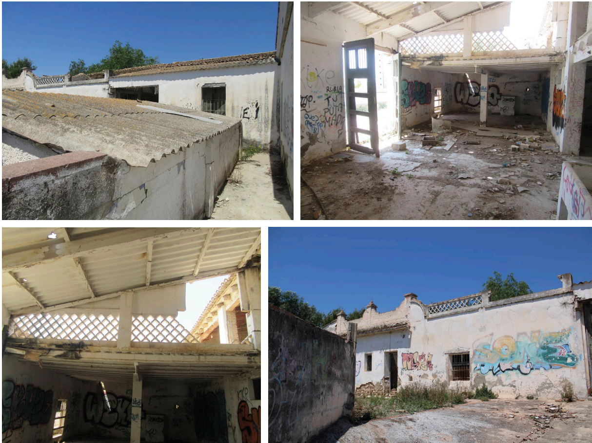
Fig. 11, 12, 13 i 14: Dependències de treball, en ruïnes, i amb pintades i grafitis [Fotografia], 2021, Arxiu del CEL.