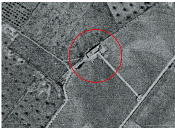
Fig. 2: Vista aèrea de 1956.