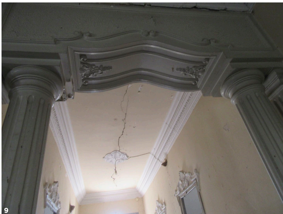
Fig. 9 i 10: Vestíbul i passadís d'entrada a la casa, amb columnes estriades que donen a la sala principal i un xicotet pati al fons. Escaioles al sostre i en els marcs de les portes [Fotografia], 2021.