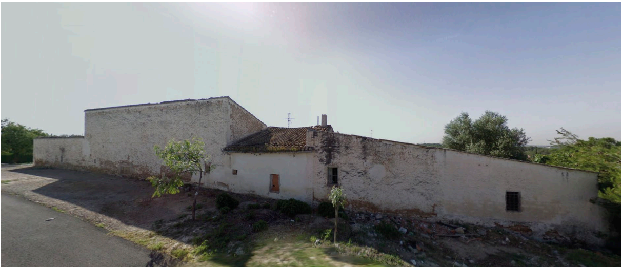
Fig. 16 i 17: Aspecte de la masia abans de l'enderrocament, des del carrer Cova Santa.