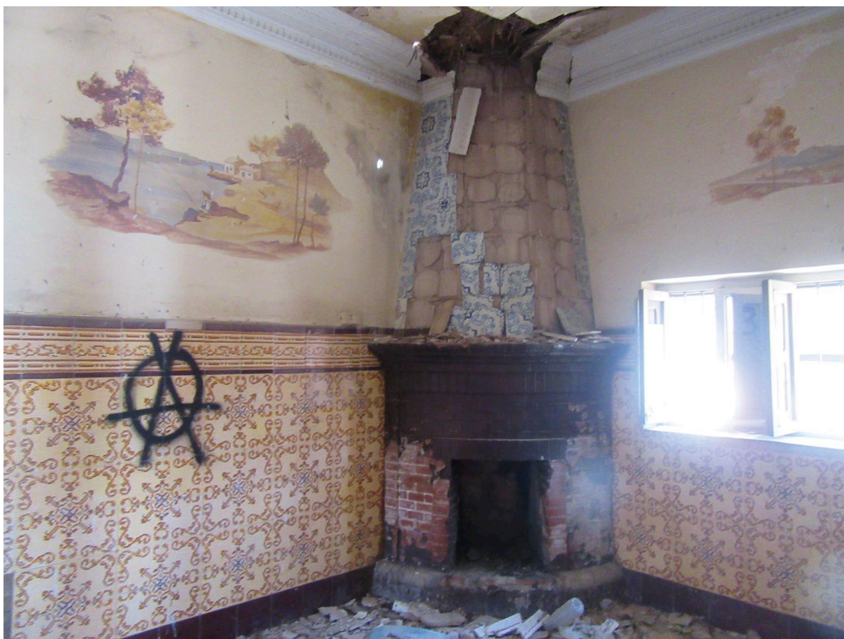
Fig. 5: El saló principal, tot i que en molt mal estat, conservava la xemeneia, les peces de ceràmica que recobrien les parets i pintures murals que reproduïen barraques i escenes de la natura [Fotografia], 2021, Arxiu del CEL.