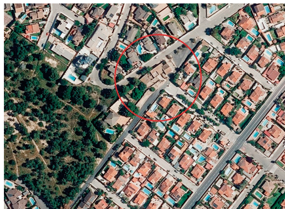
Fig. 3: Parcel·lació actual de la propietat.

Nota: Adaptat d' Ortofoto de 1956-1957 de la Comunitat Valenciana, 2016d, CC BY 4.0 © Institut Cartogràfic Valencià, Generalitat.