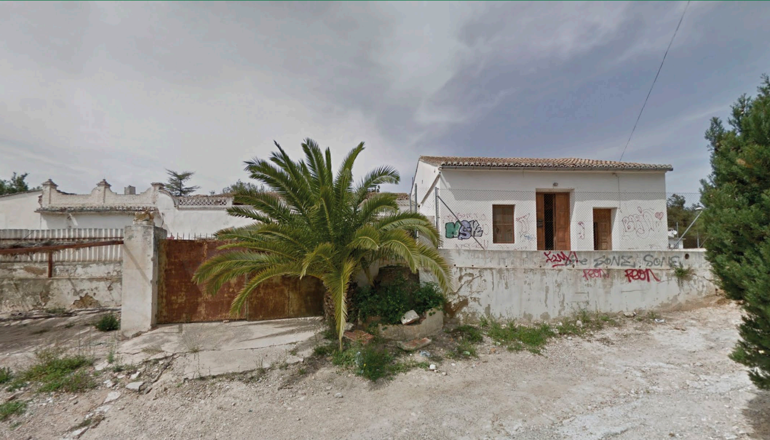
Fig. 1: Aspecte de la masia, abans de ser enderrocada en juliol de 2022.