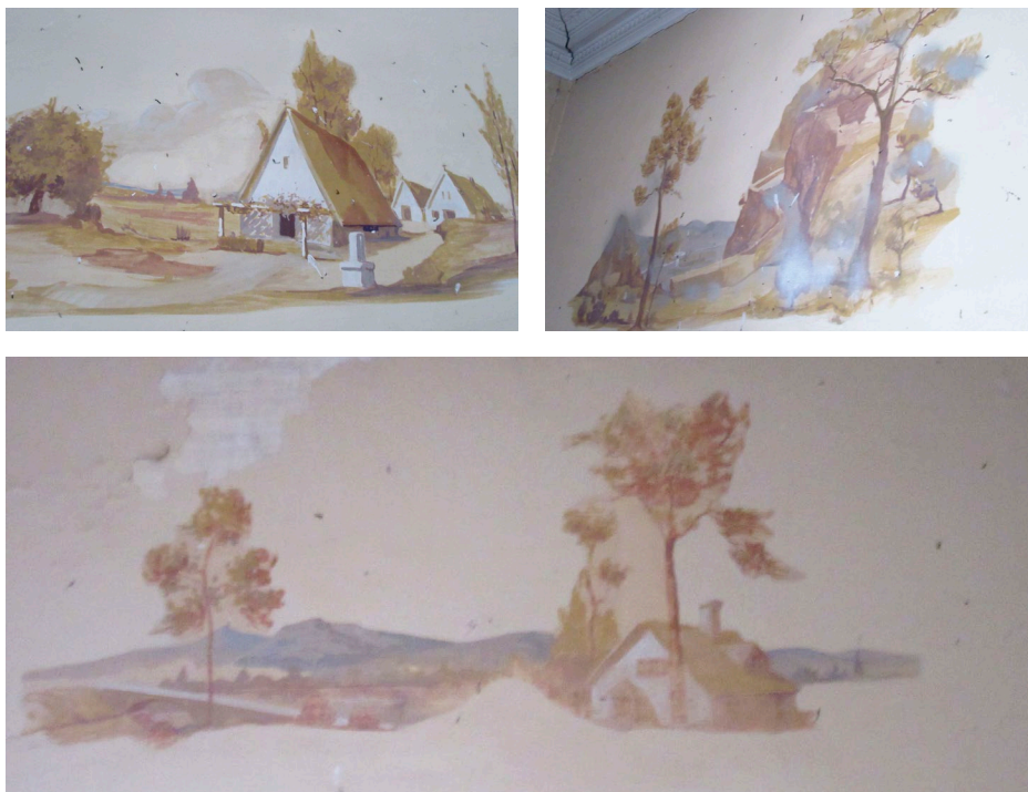
Fig. 6, 7 i 8: Pintures murals de l'interior de la masia, amb representacions de la natura i elements valencians, ja definitivament desaparegudes arran de l'enderrocament de la masia en juliol de 2022 [Fotografia], 2021, Arxiu del CEL.