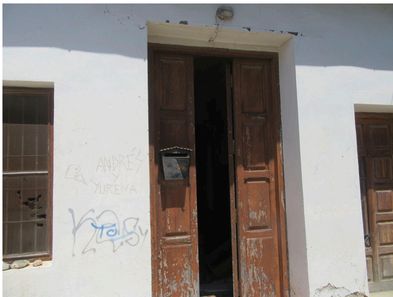
Fig. 4: Porta d'entrada a la casa des del carrer [Fotografia], 2021.