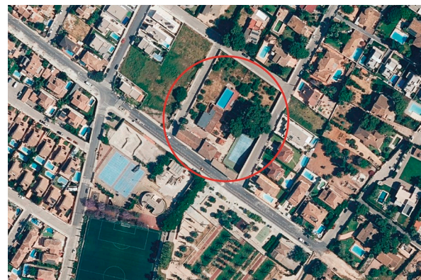
Fig. 11: La masia i parcel·lació actual de part de la propietat.