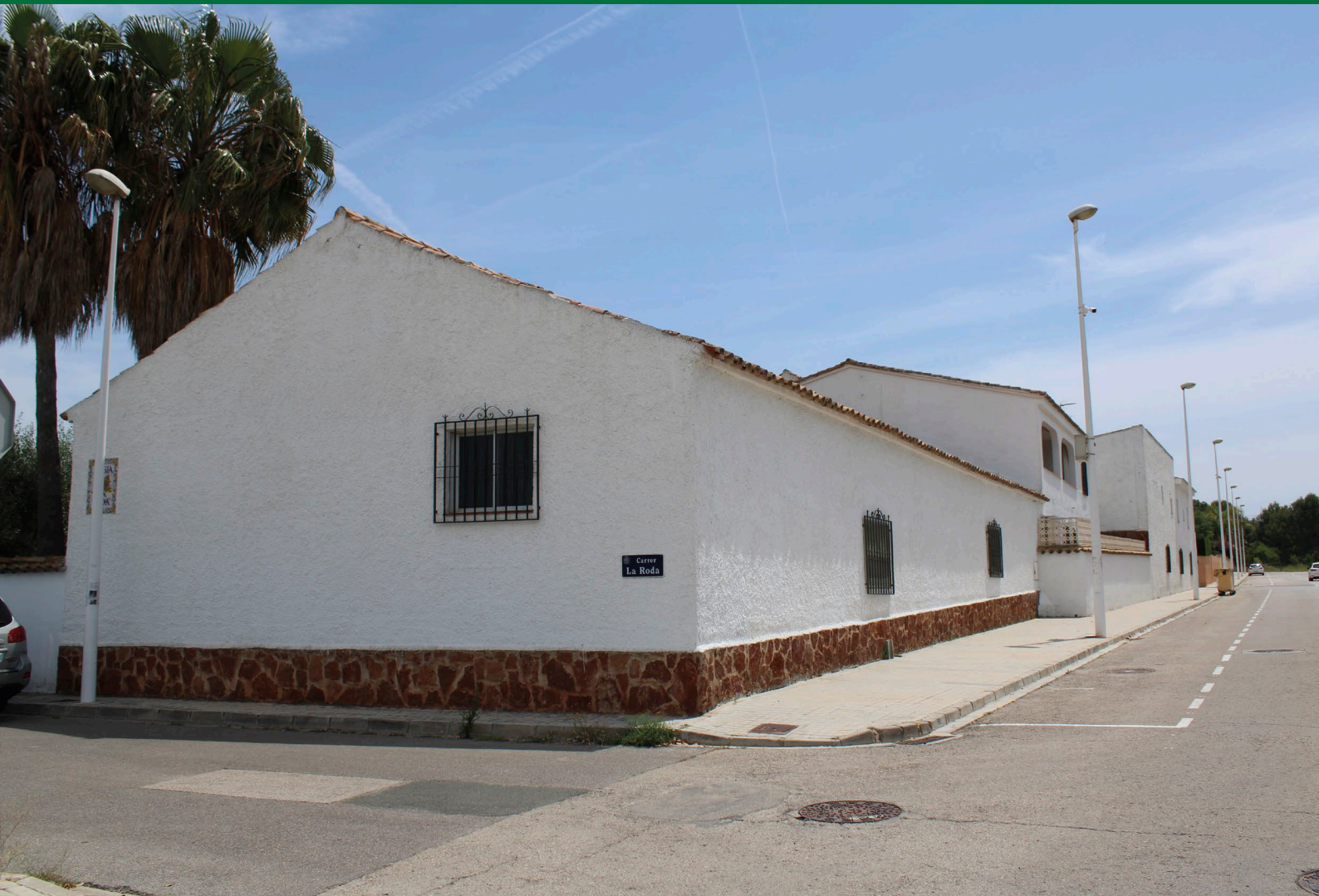
Fig. 1: Aspecte actual de la façana [Fotografia], 2021.

COORDENADES: latitud 39.5653, longitud -0.51937