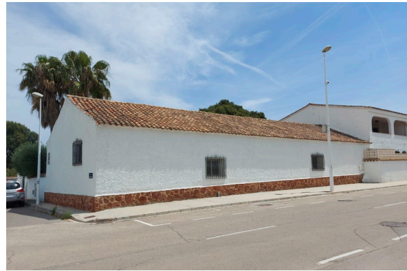
Fig. 13: Edifici conservat, cantó al carrer Concòrdia i Avinguda de les Germanies [Fotografia], 2021, Arxiu del CEL.

Santiago i Concepció Vivas López , els quals van parcel·lar la finca en xalets, quedant-se l'encerclat, amb els habitatges i la masia.