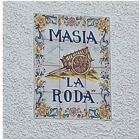
Fig. 6: Imatge aproximada d'una «roda de molí» que donava nom a la masia.