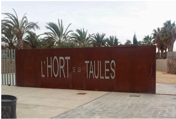
Fig. 12: Entrada a l'Hort de les Taules, parc construït en terrenys de la propietat [Fotografia], 2021, Arxiu del CEL.