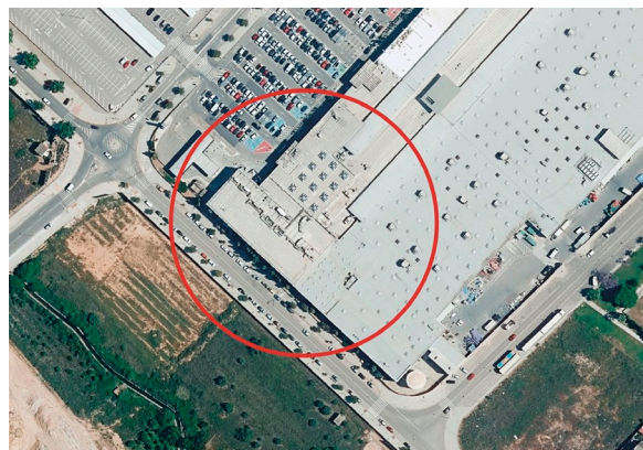
Fig. 3: L'actual Centre Comercial «El Osito» sobre els terrenys on se situava la Masia de Blanes, de la qual no en queda cap rastre.