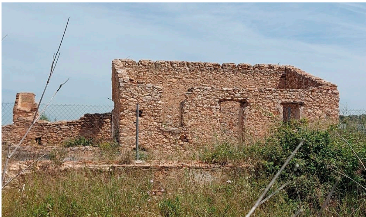
Fig. 5: Façana de la masia que dona al carrer Vereda. Prou desmantellada, sense sostre i amb unes poques parets en peu [Fotografia], 2021.

En la visita pastoral de l'any 1920 trobem una referència a la masia en les notes de l'església de Sant Jaume Apòstol de la Pobla de Vallbona, quan nomena l'oratori que hi havia