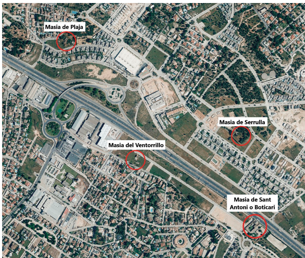
Fig. 3: Recreació sobre el mapa de les masies cedides a Sant Antoni de Benaxeve.

Nota: Adaptat d'Ortofoto de 1956-1957 de la Comunitat Valenciana, 2016m, CC BY 4.0 © Institut Cartogràfic Valencià, Generalitat.