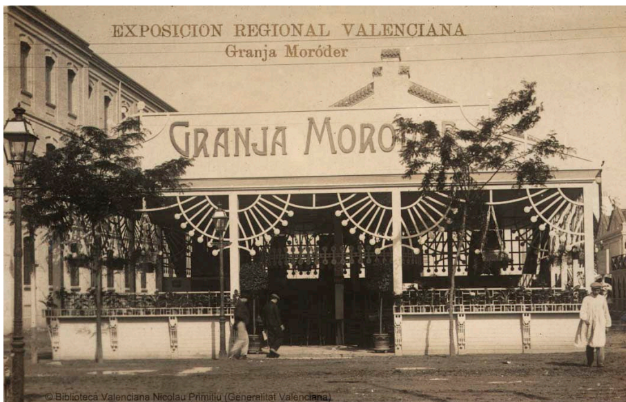
Fig. 4: Granja Moróder, expropiada en 1938 i convertida en Universitat Agrícola.

Respecte a la Granja Moróder, cal dir que fou expropiada en 1938, en temps de la Guerra Civil, passant a ser gestionada per anarquistes per a construir la Universitat Agrícola, tot i que en acabar el conflicte, la família Moróder recuperà les seues propietats, la Universitat tancà i la granja mai més tornà a ser el que havia estat (Peraita, 2020).