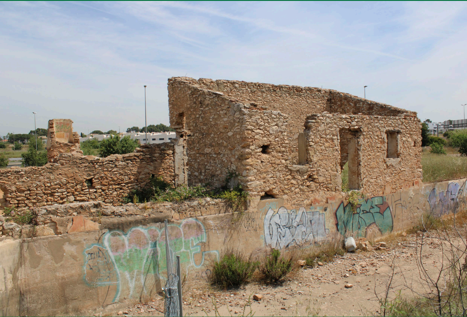
Fig. 1: Restes de la masia en l'actualitat [Fotografia],2021.

COORDENADES: latitud 39.57208, longitud -0.5156