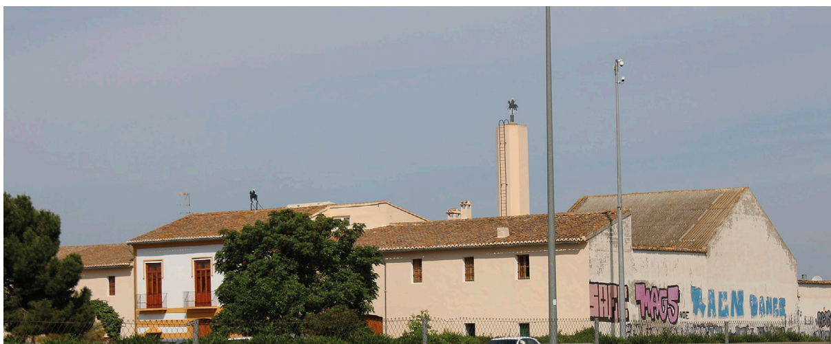
Fig. 3: La masia, vista des de l'autovia d'Ademús [Fotografia], 2021.

Nota: Adaptat d'Ortofoto de 1956-1957 de la Comunitat Valenciana, 2016n, CC BY 4.0 © Institut Cartogràfic Valencià, Generalitat.