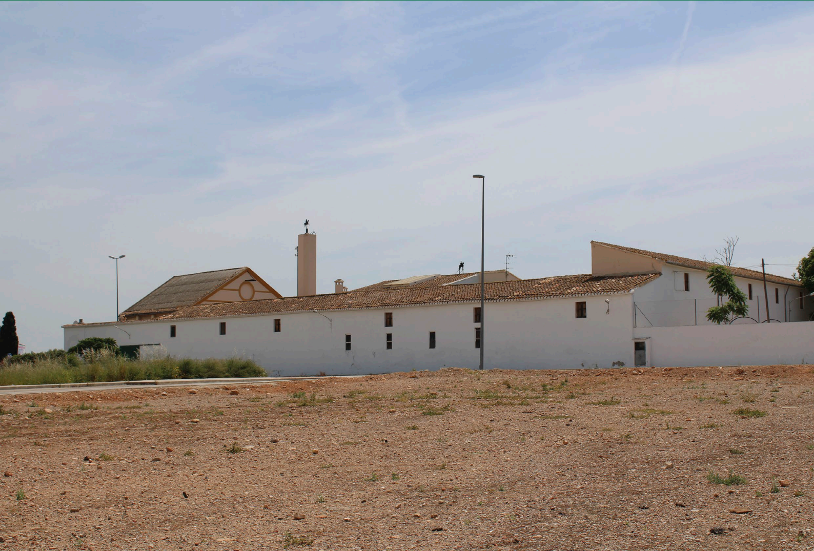
Fig. 1: Vista lateral de la masia, des del carrer Vereda [Fotografia], 2021.

COORDENADES: latitud 39.56925, longitud -0.50942