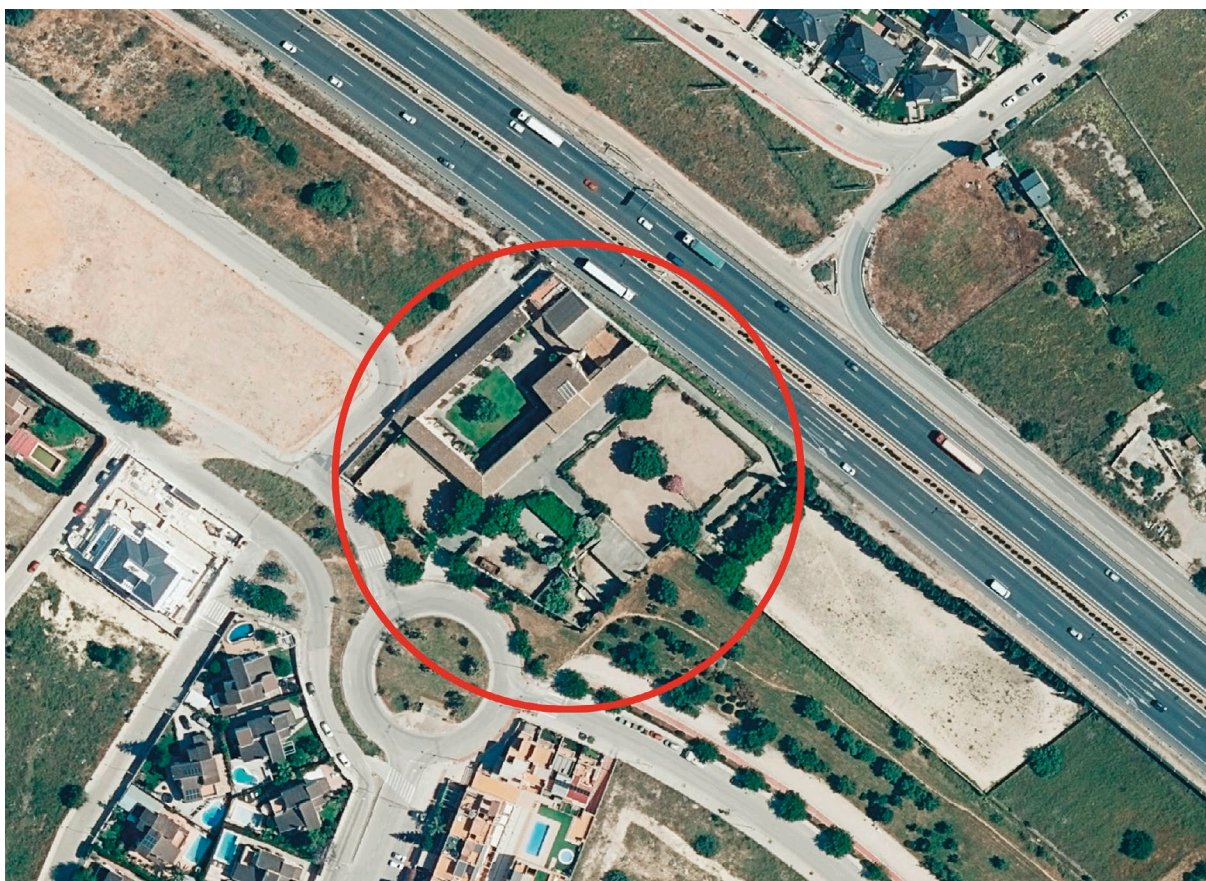
Fig. 7: Masia actual vista des de l'aire.

En l'actualitat la masia és visible des de l'autovia València-Llíria, cercada. Se'n conserven més de tres quartes parts.