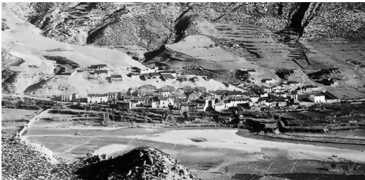
Fig. 5: Antic nucli de Benaixeve en 1935, abans de la construcció de l'embassament.