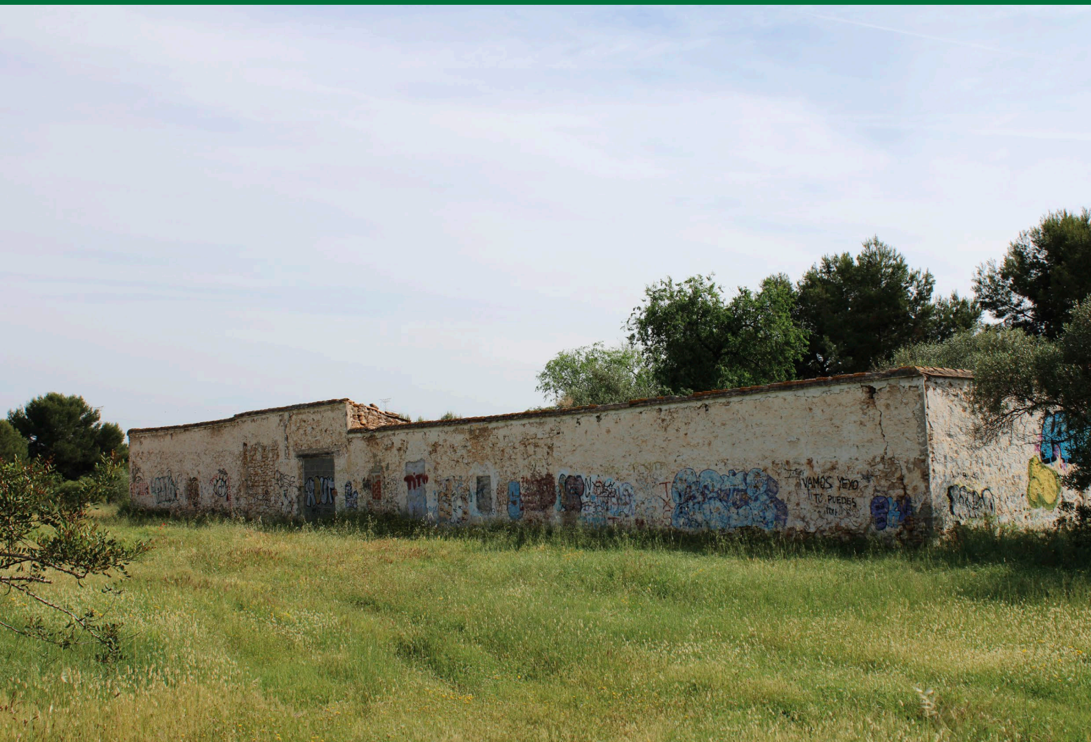
Fig. 1: Aspecte actual de la masia [Fotografia], 2021.

COORDENADES: latitud 39.54213, longitud -0.47858