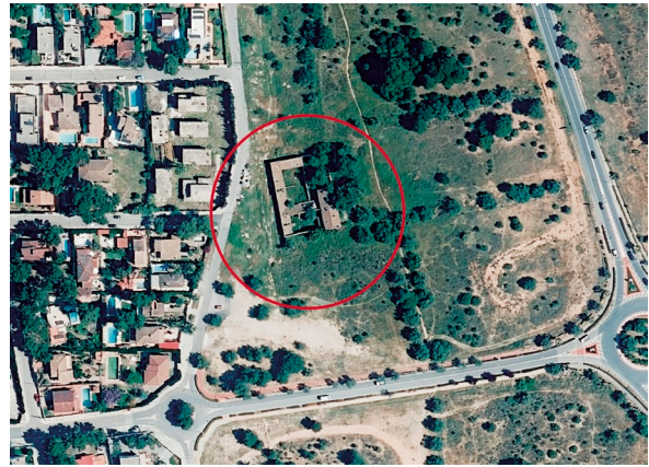
Fig. 3: Vista aèria actual.

Nota: Adaptat d'Ortofoto de 1956-1957 de la Comunitat Valenciana, 2016q, CC BY 4.0 © Institut Cartogràfic Valencià, Generalitat.