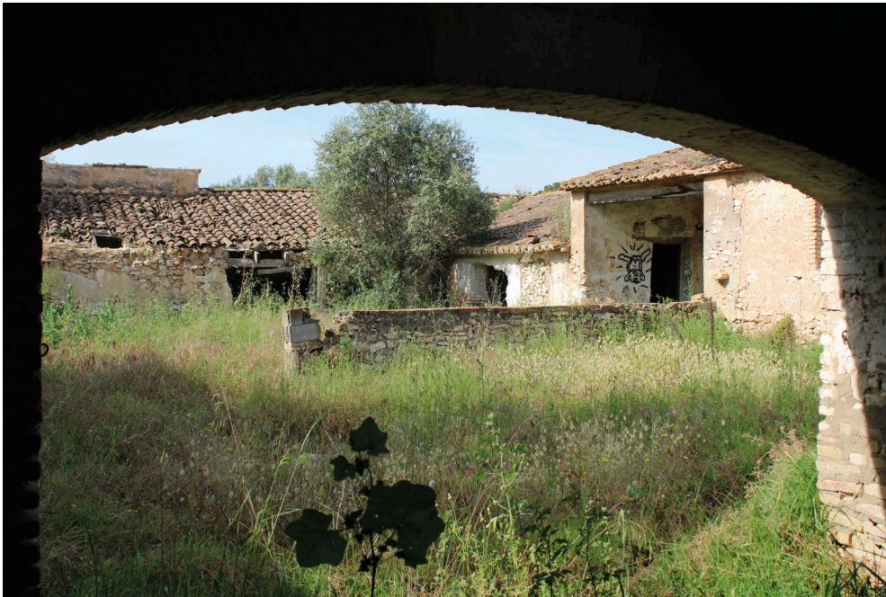
Fig. 13: Pati interior [Fotografia], 2021, Arxiu del CEL.