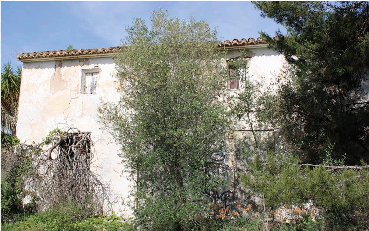
Fig. 5: Aspecte actual de la masia [Fotografia], 2021, Arxiu del CEL.

Les terres limitaven pel nord-oest amb la Masia del Pla del Pou , per l'oest amb la Masia de la Vallesa de Mandor i pel sud-est amb La Canyada de la Penya.