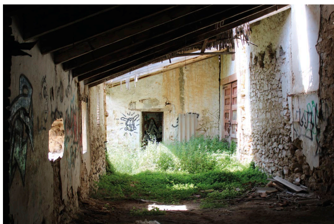
Fig. 6, 7, 8, 9, 10, 11 i 12: L'abandó de la masia ha provocat l'actual aspecte de ruïna [Fotografia], 2021, Arxiu del CEL.