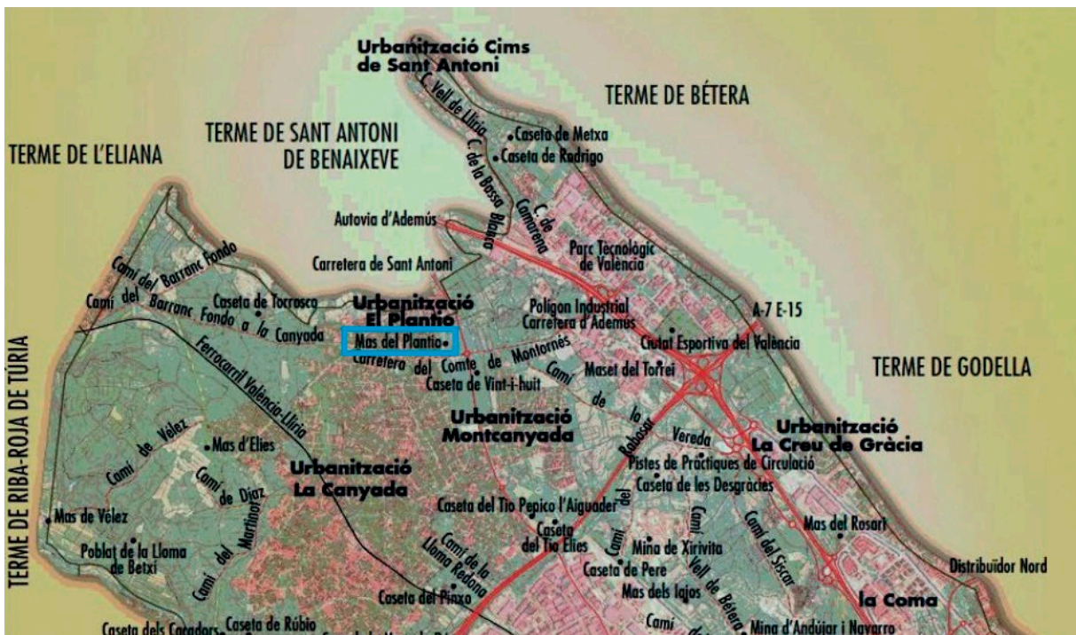
Fig. 4: Situació de la Masia del Plantio en el mapa.

Nota: Adaptat d'Ortofoto de 2022p de la Comunitat Valenciana, CC BY 4.0 © Institut Cartogràfic Valencià, Generalitat.