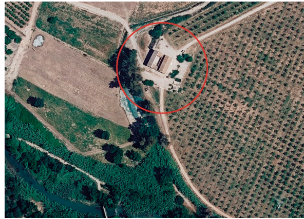
Fig. 3: Vista aèria actual, amb l'entorn poc modificat.

Nota: Adaptat d'Ortofoto de 1956-1957 de la Comunitat Valenciana, 2016r, CC BY 4.0 © Institut Cartogràfic Valencià, Generalitat.