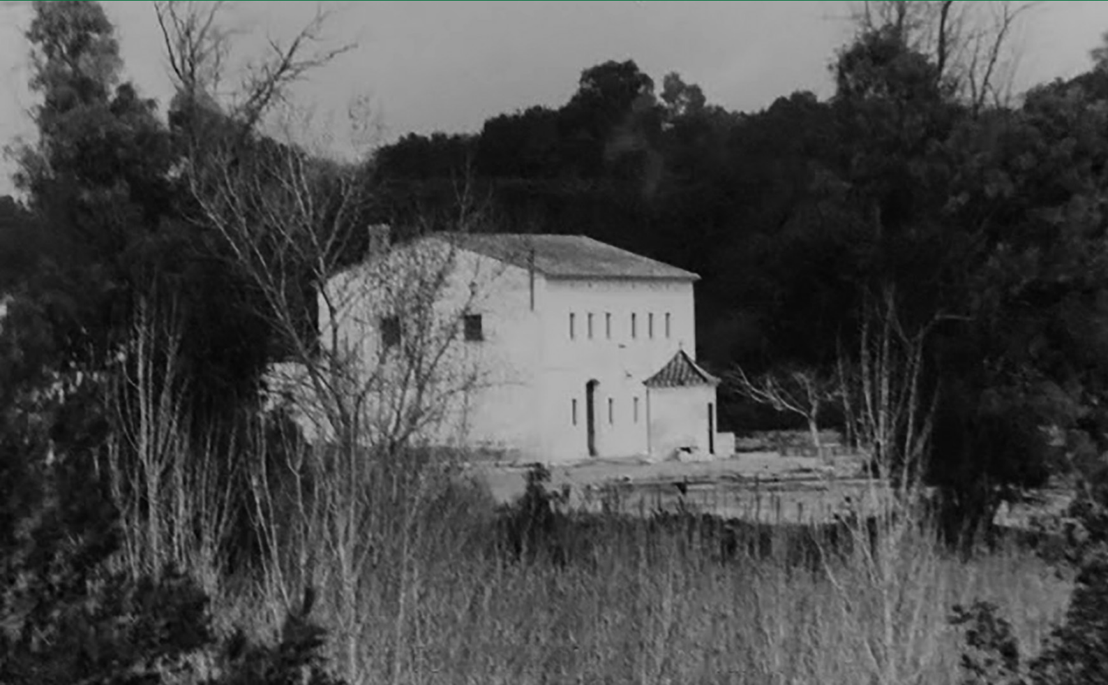
Fig. 1: La Masia de Vélez en 1979.

Nota: Reproduït d' El Más de Vélez, está situado en la frontera entre Paterna y Ribarroja del Turia [fotografia], per F. Martínez, 1979a, Apuntes de Paterna . Blog Visual. Publicat amb permís de F. Martínez.