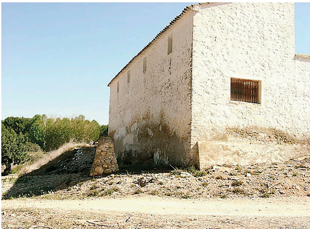
Fig. 5: Vista posterior de la masia, amb el molló de separació.