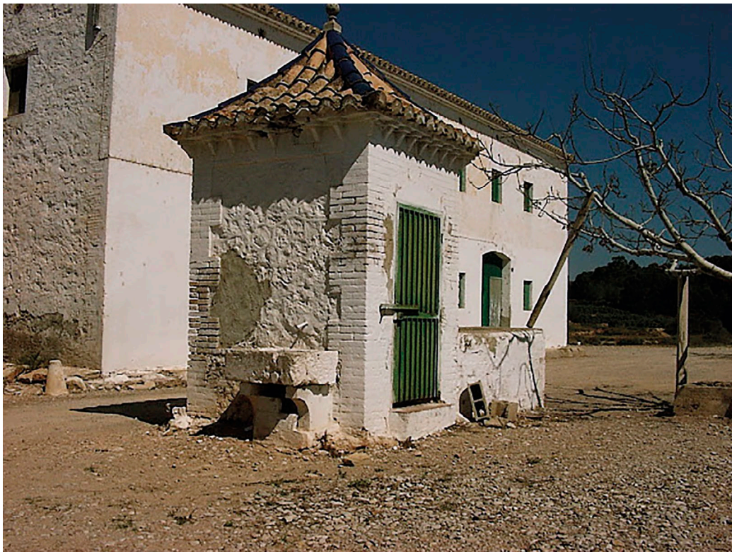
Fig. 4: Vista davantera de la masia amb el pou.

Nota: Adaptat d'Ortofoto de la Comunitat Valenciana, 2022q, CC BY 4.0 © Institut Cartogràfic Valencià, Generalitat.