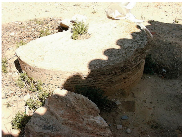
Fig. 6: Restes d'un molí romà.

Nota: Reproduït de Junto al Mas, se encontraba una antigua Villa Romana, esta Muela son los restos de un antiguo Molino [Fotografia], per F. Guzmán, 2000c, Apuntes de Paterna. Blog Visual. Publicat amb permís de F. Martínez.