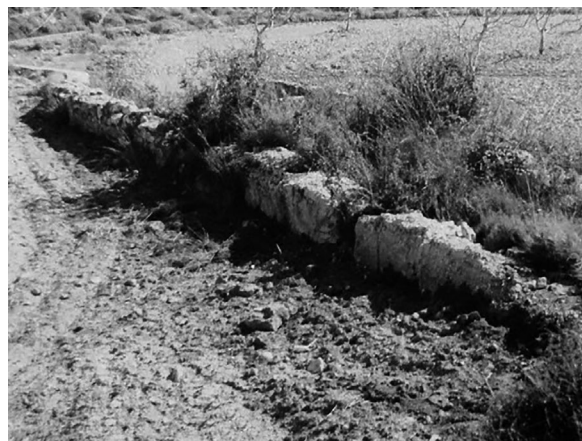
Fig. 7: Restes del canal romà.