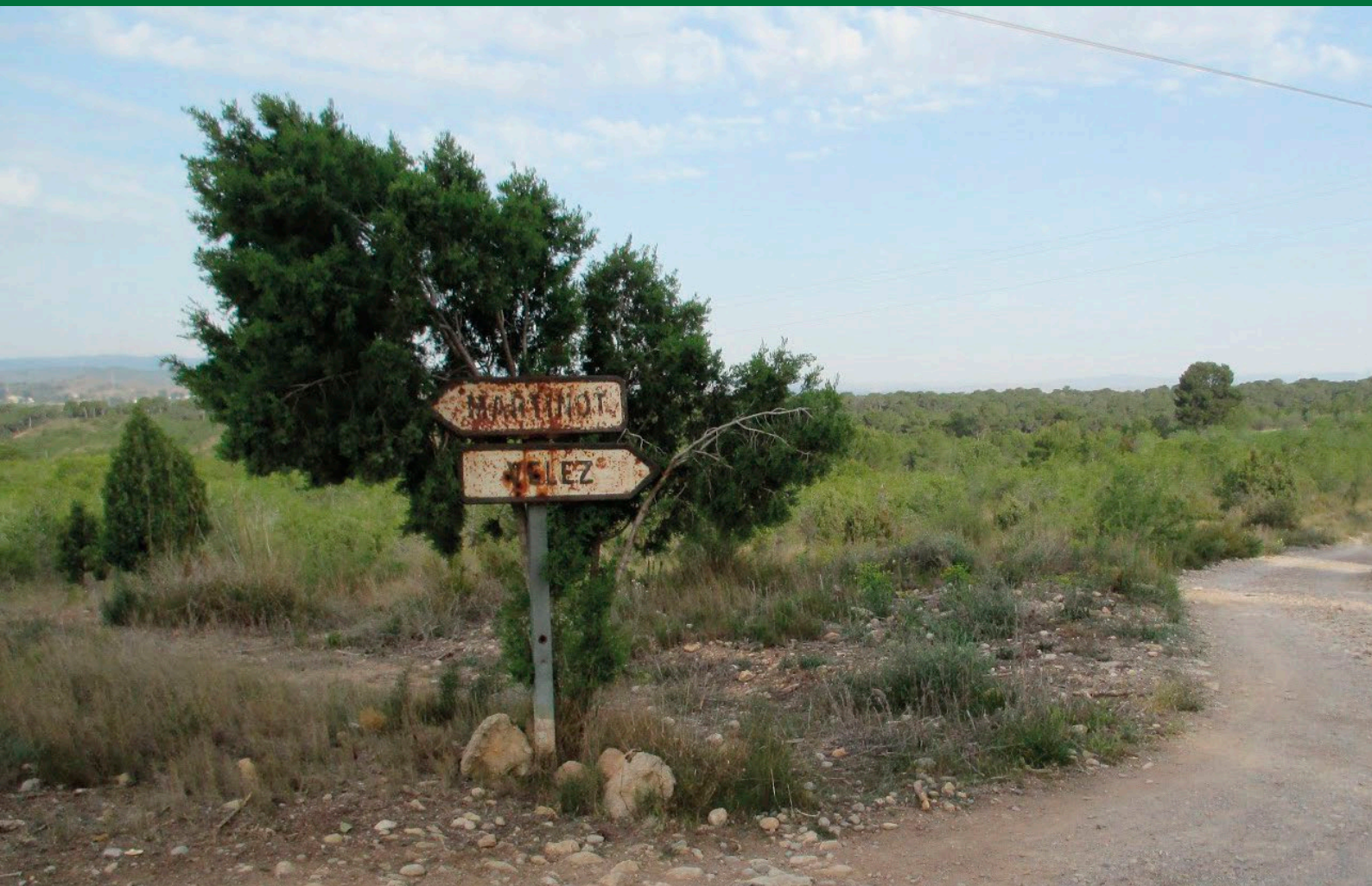
Fig. 1: Senyalitzadors a les masies de Vélez i Martinot en el camí de Díaz.

Nota: Adaptat de Caminos de Paterna: El camino de Díaz , de F. Martínez, 2018, Apuntes de Paterna. Publicat amb permís de l'autor.