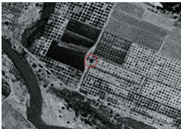
Fig. 2: Vista aèria de 1956.

Nota: Adaptat d'Ortofoto de 1956-1957 de la Comunitat Valenciana, 2016s, CC BY 4.0 © Institut Cartogràfic Valencià, Generalitat.