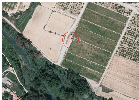
Fig. 3: Vista actual.

Nota: Adaptat d'Ortofoto de 1956-1957 de la Comunitat Valenciana, 2016s, CC BY 4.0 © Institut Cartogràfic Valencià, Generalitat.